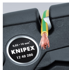
Draadsnijder tot 10 mm 2 meerdradig