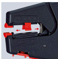
12 40 200: Verstelbare lengteaanslag