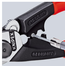
De eindhulzen op de trekkabel persen