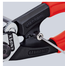
De eindhulzen op de Bowden-huls persen