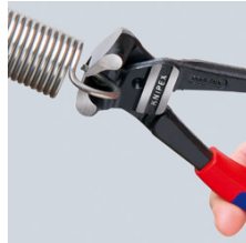
Hoge snijcapaciteit: ook voor pianodraad