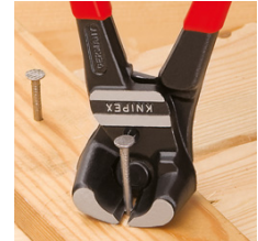
Bijna vlak afsnijden van bouten, nagels, etc.

Onder voorbehoud van technische wijzigingen en vergissingen