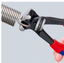
Capacité de coupe élevée, même avec de la corde à piano